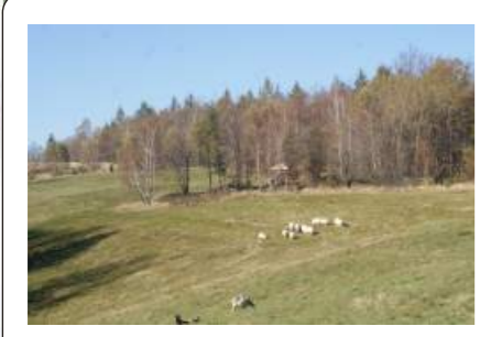
Chata na Trzonce